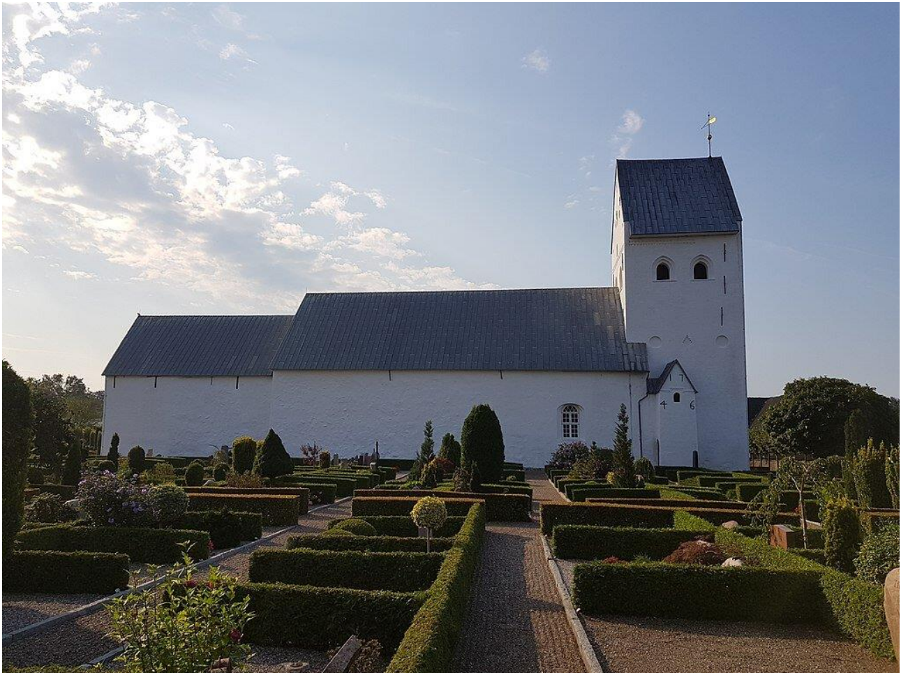
Ravsted kirke, bygget ca. 1100.