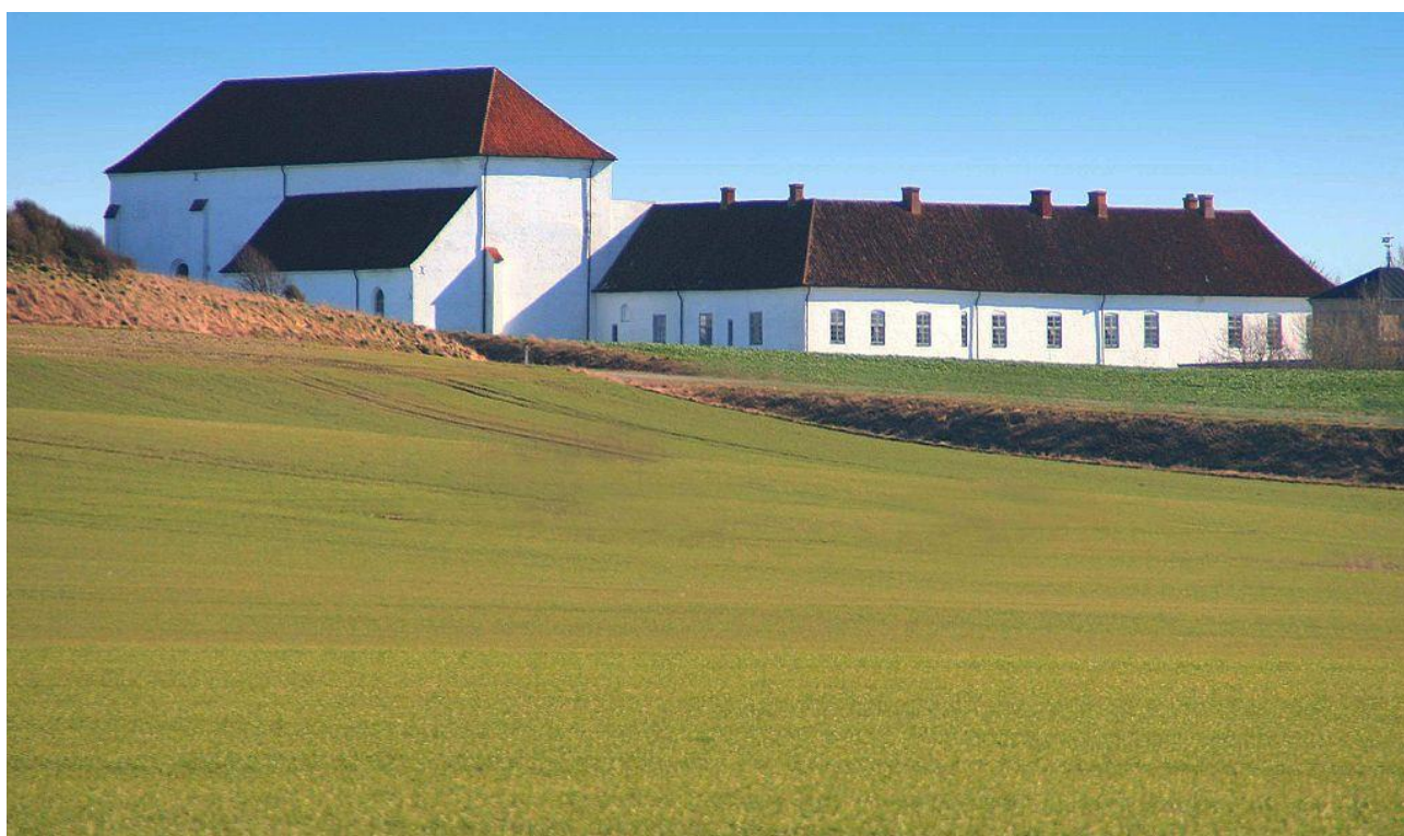
Børglum Kloster.